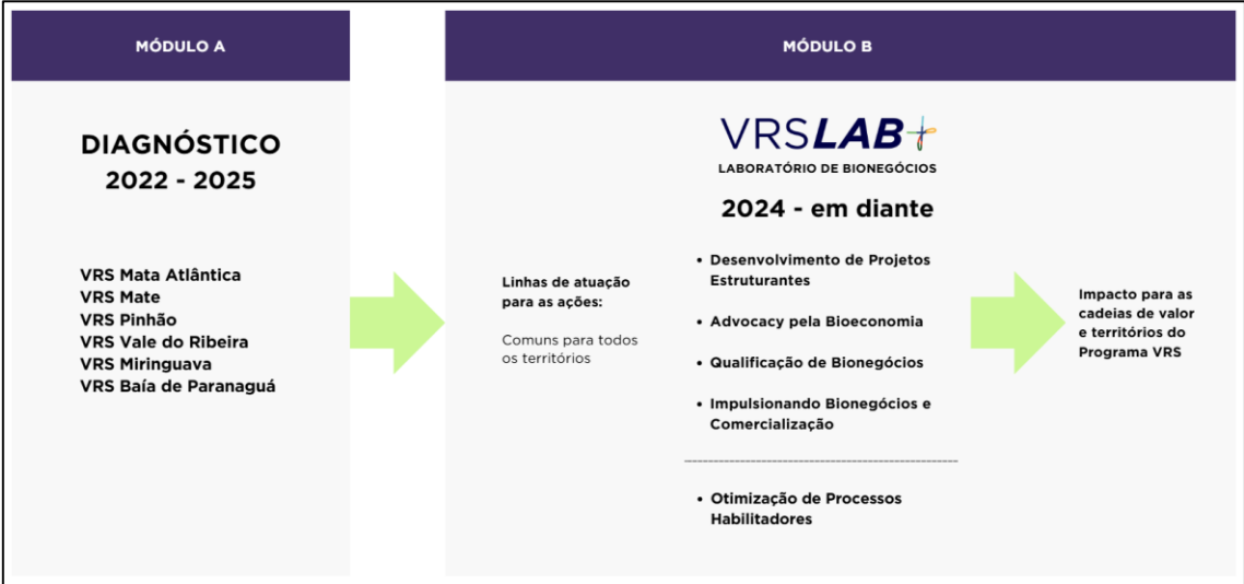
FIGURA: ESCOPO DE ATUAÇÃO DOS MÓDULOS

Por meio de ações nas linhas de atuação do VRSLAB+ o Vocações Regionais Sustentáveis irá promover os objetivos de cada cadeia de valor trabalhada, buscando otimizar temáticas e demandas em linhas de atuação, sem deixar de atender o “Plano de Implementação e Ações de Apoio” construído em conjunto com os territórios. A figura a seguir apresenta este esquema lógico de forma visual: